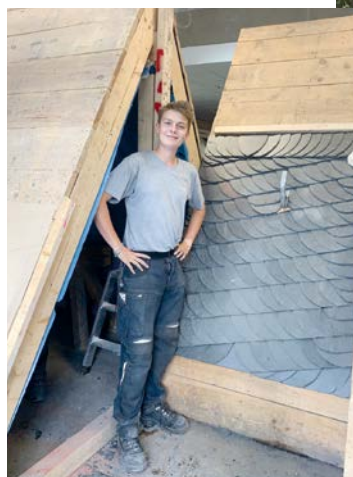
Am Boden gelernt, auf dem Dach angewendet. So gelingt die Ausbildung zum Dachdecker.

im Dachdeckerhandwerk Tradition großgeschrieben wird, kommen neue Techniken zum Einsatz. Es geht hier eben beides: Schieferhammer und iPad. Infos zum Beruf und Hilfe bei der Suche nach einem passenden Ausbildungsbetrieb gibt es hier: www.dachdeckerdeinberuf.de . (akz-o)