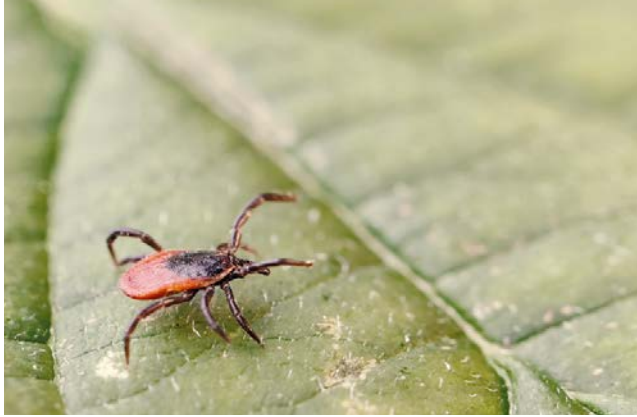
In FSME-Risikogebieten gibt es ein erhöhtes FSME-Risiko. Zecken können jedoch deutschlandweit vorkommen.

FSME ist eine Erkrankung der Hirnhäute und des zentralen Nervensystems und kann in schweren Fällen tödlich verlaufen. FSME ist mit Medikamenten nicht heilbar, jedoch kann man sich durch Impfen schützen. Für den Aufbau des Impfschutzes sind mehrere Impfungen nötig. „Wer einen Impfschutz für die aktuelle Zeckensai-