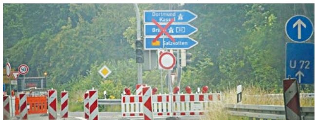
Die Sperrung der Auffahrt bei Elsen zur A33 soll kommende Woche aufgehoben werden.

Paderborn-Elsen. Die langwierige Sperrung der Auffahrt zur A33 (Elsen) Richtung Brilon nähert sich dem Ende. Voraussichtlich am 4. Juli soll die Auf- und Abfahrt wieder freigegeben werden. Damit hat sich die Fertigstellung erneut verzögert, was mit Lieferengpässen beim Baumaterial begründet wird. Nach der Freigabe wechselt die Großbaustelle allerdings die Fahrtrichtung. Erneuert wird dann die Fahrbahn in Richtung Bielefeld mit der Auf- und Abfahrt zum Kreisverkehr am Fußballstadion (B1). Eine Auffahrt