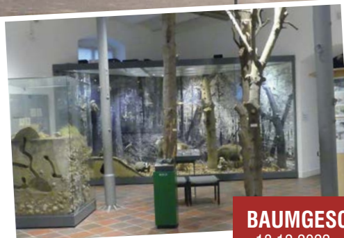
Das Naturkundemuseum ist Ort der neuen Schülerausstellung.