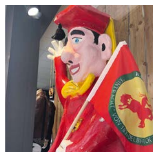
Karneval in Delbrück wieder mit vielen karnevalistisch dekorierten Schaufenster in der Delbrücker Innenstadt.