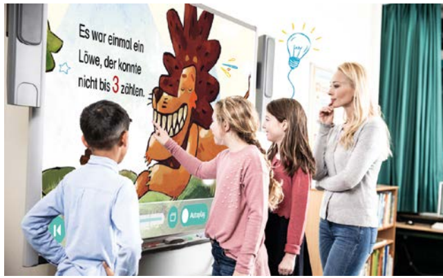
Bilderbuchkinos zum Ausleihen bietet jetzt die Kinderbibliothek an.

Paderborn. Ob für eine Vorlesestunde, die gemütliche Lesecke oder doch eine bunte Themenparty – Digitale Bilderbuchkinos sind vielseitig einsetzbar und ermöglichen einen kindgerechten Zugang zur Literatur. Doch was ist ein Bilderbuchkino eigentlich? Es handelt es sich dabei um digital aufbereitete Bilderbücher, die zur Leseförderung und zum Lernen genutzt werden können. Eingesetzt werden Bilderbuchkinos insbesondere bei der Sprach- und Leseförderung.