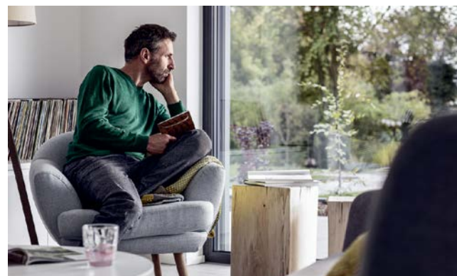
Bei der Auswahl der Fenster spielen Design und Nachhaltigkeit ebenso eine Rolle wie Schall- und Wärmedämmung.

Ein eigenes Haus zu bauen, bedeutet im Vorfeld viel Planung - zum Beispiel bei den Fenstern. Holzfenster lassen Räume urig-gemütlich erscheinen. Einen modernen, klaren Look kreieren Aluminiumfenster, die preislich eher im höheren Bereich angesiedelt sind. Eine dritte Möglichkeit sind Kunststofffenster aus PVC. Sie sind sowohl pflegefreundlich als auch langlebig und bieten eine gute Wärmedämmung. Das vielfältig einsetzbare Material kann beispielsweise im Rahmen des Rehau Kaleido Color Oberflächen- und Farbprogramms in allen RAL-Farben lackiert oder foliert werden, um verschiedene Effekte zu erreichen. Unter fenster.rehau.de/fensterdesign kann man sich