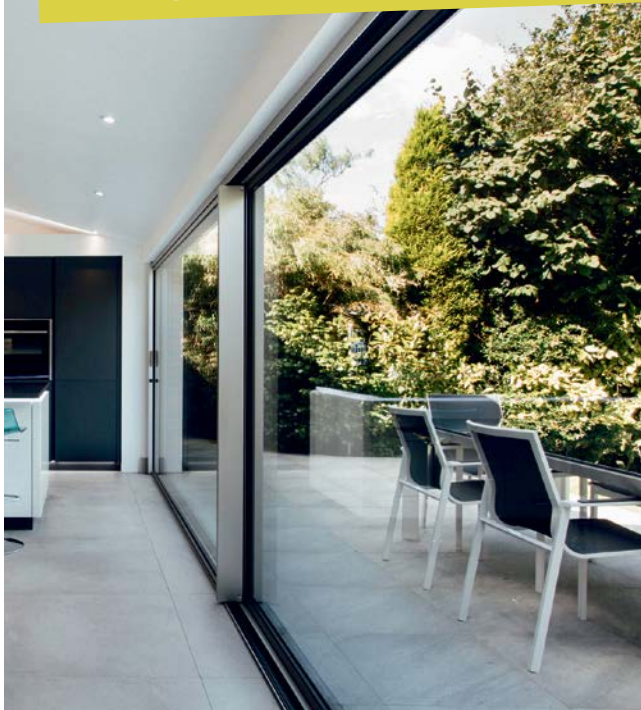
Je mehr Sonne ins Haus gelassen wird, desto mehr Geld lässt sich sparen. Das Schiebefenster sorgt zudem für einen nahtlosen Blick in die Natur.

Staatliche Förderung für den Austausch von Fenstern, Terrassen- und Schiebetüren