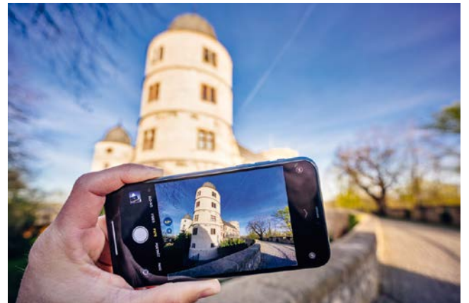
Frühlingsbilder von der Wewelsburg gesucht: Kreismuseum Wewelsburg ruft Fotowettbewerb aus.

„Eine große Auswahl der eingereichten Bilder wird vom 4. Juli bis 13. August 2023 bei uns im Kreismuseum Wewelsburg ausgestellt“, kündigt John-Stucke an. Im Rahmen der Ausstellung können die Besuchenden per Stimmzettel ihr Lieblingsmotiv wählen. Das Gewinnerbild wird mit einem iPad prämiert. Die Fotos können ab sofort unter Angabe der Kontaktdaten an service@wewelsburg.de gesandt werden; Einsendeschluss