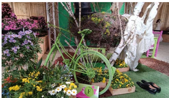
Thema Vogelhochzeitin der Blumenhalle der Landesgartenschau Höxter.

Hövelhof. Der DRK Ortsverein Hövelhof organisiert zwei Ausflüge. Am Donnerstag, den 01.06.2023 startet der Bus um 8:30 Uhr zur Landesgartenschau im schönen Weserbergland. Nach einer Führung (90min) erleben Sie einen tieferen Einblick rund um das Thema Blumen, Gärten und Natur. Im Anschluss wird die Gruppe in der Gastronomie am Marktplatz verköstigt und kann dann einen Bummel über die Landesgartenschau unternehmen. Gegen 19 Uhr wird der Bus wieder am Begegnungszentrum an der Bahnhofstr.30 erwartet. Anmeldung werden bis zum 15.05.2023 angenommen. Am Donnerstag, den 10.08.2023 steht Köln auf dem Ausflugsprogramm. Der Bus startet um 8:00 Uhr und wird wieder um ca. 20:30 Uhr in Hövelhof erwartet. Die Gruppe wird an einem unterhaltsamen Stadtspaziergang um den Dom über eine römische Hafensstraße in die verwinkelte Kölner