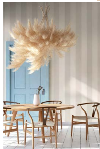
Streifenmuster für die Wand sind zeitlos schön und liegen immer im Trend.

morgen schlägt. Mit einer großen Bandbreite an Farbtönen, Mustern und sogar in-