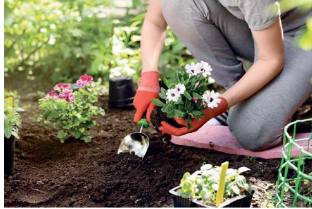
Im heimischen Garten ist der Umstieg auf torffreie Pflanzerden denkbar einfach.

hängig von der Zusammensetzung speichert das eher lockere Substrat im Vergleich zu torfhaltiger Erde Wasser und Nährstoffe weniger gut. Daher ist es gerade bei der Kultivierung von Topf- oder Kübelpflanzen hilfreich, der neuen Erde Tongranulat beizumischen, um Feuchtigkeit zu halten. Grundsätzlich gilt: Die Erdfeuchte regelmäßig kontrollieren und bei Bedarf etwas häufiger gießen. Auch das Düngen sollte öfter wiederholt werden. In der Regel reicht es, mit einem organischen Flüssigdünger für die passende Nährstoffzufuhr zu sorgen. (spp-o)