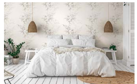
Für einen hochwertigen Auftritt sollten Tapeten von erfahrenen Fachbetrieben verarbeitet werden.

dividuellem Digitaldruck findet jeder die passende Variante für sein Zuhause. Damit die Motive fachgerecht an die Wand kommen, ist der Malerbetrieb die richtige Anlaufstelle. Mit dem Fachbe-