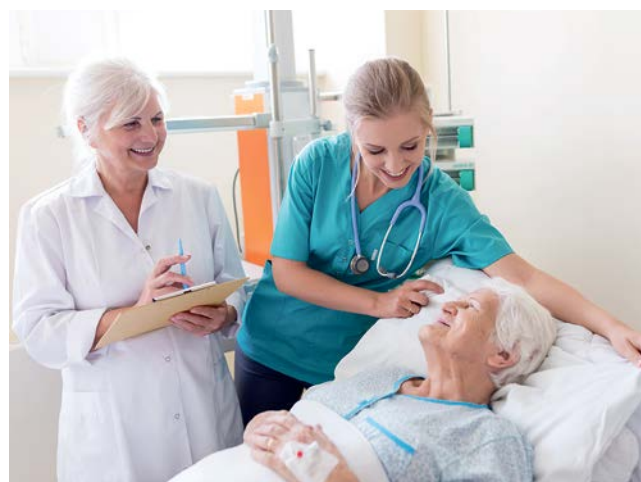
Die Ausbildungsordnung zur Pflegefachkraft wurde 2020 vereinheitlicht und ähnelt künftig dualen Ausbildungsgängen, da Praxis und Theorie gleichermaßen gelehrt werden.

Menschen beruhigen und manchmal trösten, Medikamente verabreichen, bei der Körperpflege helfen und mit Ärzten sprechen: Wer in der Pflege arbeitet, braucht neben fachlichem Know-how auch Einfühlungsvermögen und Kommunikationsfähigkeiten. Jedes Jahr am 12. Mai macht der Tag der Pflege darauf aufmerksam, wie anspruchsvoll und vielseitig die Arbeit in diesem Berufsfeld ist. Seit 2020 nimmt darauf auch die Ausbildungsordnung Rücksicht: Die getrennten Ausbildungswege für die Kranken-, Alten- und Kinderkrankenpflege sind Geschichte. Sie wurden ersetzt durch die einheitliche Ausbildung zur Pflegefachfrau bzw. zum Pflegefachmann. Nun stehen in den ersten beiden Jahren der dreijährigen Ausbildung Inhalte auf dem Lehrplan, die für alle Pflegeberufe relevant sind: medizinisches Wissen und pflegerische Basics, aber auch Kommunikation mit den gepflegten Menschen und mit Ärzten. Die Auszubildenden schnuppern dabei auch ganz praktisch in unterschiedliche Pflegebereiche hinein. Sie lernen beispielsweise die Arbeit in Seniorenheimen, in psychiatrischen Einrichtungen oder im Krankenhaus kennen - ganz schön vielfältig! Dieses breite