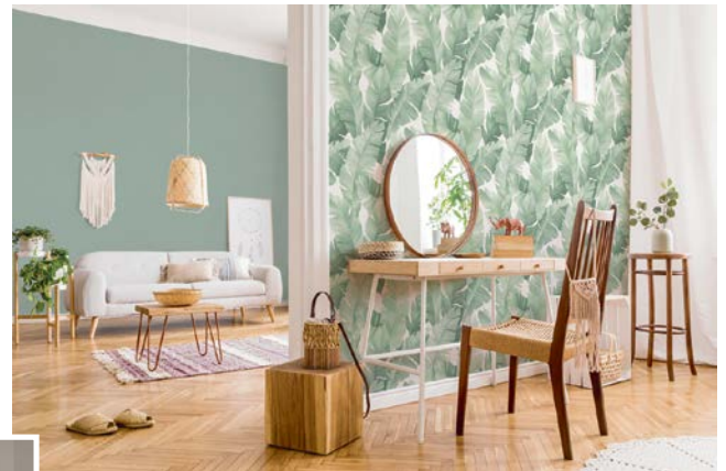
Tapeten machen Räume: Der Wandschmuck prägt ganz entscheidend die Atmosphäre des Zuhauses.

Tapeten kleiden Wände seit Jahrhunderten und verschönern so das Zuhause. Ob als Akzent an einer Wand oder im ganzen Raum: Tapeten sind ein Eyecatcher und unterstreichen jeden Wohnstil. Klassische Muster werden dabei ständig neu interpretiert. Das zeigt etwa die umfangreiche Tapetenkollektion „MyHome 2024“ von Brillux, die eine Brücke von klassischen Motiven mit einem Twist zu angesagten neuen Designs von