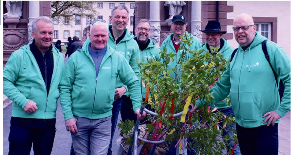
Der Förderverein Landesgartenschau Bad Lippspringe überreichte den Förderverein Höxter zur Eröffnung einen Baum, den sie zusammen mit dem Fahrrad nach Höxter brachten.