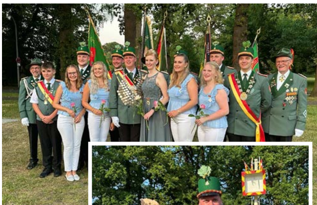
Das neue Königspaar von Elsen mit seinem Hofstaat.

Elsen. Nicht nur in Paderborn sind die Feierlichkeiten der Schützenvereine wichtiger Bestandteil der regionalen Kultur und beliebter Treffpunkt für Jedermann. Ob jung oder alt – hier wird gemeinsam gelacht, getanzt, gefeiert und das Miteinander genossen. Aus diesem Grunde hat sich die St. Hubertus-Schützenbruderschaft in diesem Jahr dem Motto „Zusammen feiern – Tradition bewahren“ verschrieben und lädt vom 01. bis 03. Juli 2023 herzlich zum Schützenfest nach Elsen ein.