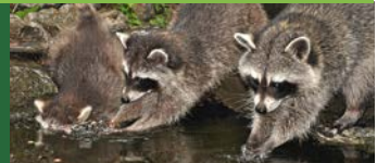
Der Waschbär, ursprünglich aus Nordamerika, ist mittlerweile bei uns heimisch geworden