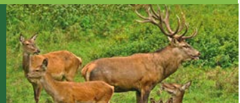
Der Rothirsch: „König der Wälder“, imposant und stark.