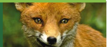
Der Fuchs: sehr scheu und normalerweise kaum zu sehen, ist er hier in Ruhe zu studieren