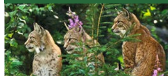
Der Luchs: wieder auf dem Vormarsch im Arnsberger Wald und im Wildpark gut zu beobachten