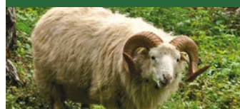
Skudden: die ostpreußischen Skudden-Schafe finden Sie an verschiedenen Standorten, vor allem rund um den Bilsteinfelsen