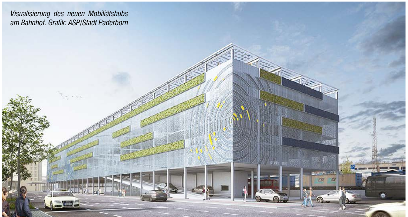
Visualisierung des neuen Mobilitätshubs am Bahnhof.

teren, alternativen Standorten für ein Fahrradparkhaus umzusehen. Ein solches, zusätzliches und komplett neues Fahrradparkhaus sei viel zu teuer. Es werde also am falschen Ende gespart. Während sich alle anderen Parteien über die Notwendigkeit eines Mobilitätshubs am Bahnhof aber einig sind, schert die AFD komplett aus. Man brauche das Fahrradparkhaus mit Parkhaus und integrierter Bushaltestelle nicht.