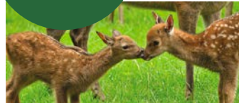
Der Sikahirsch, eigentlich in Ostasien heimisch, lebt hier im Arnsberger Wald.