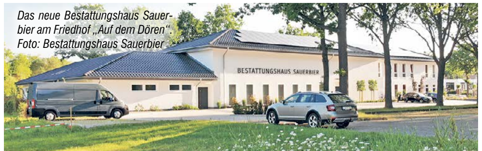
Das neue Bestattungshaus Sauerbier am Friedhof „Auf dem Dören“.

Tag der offenen Tür am Samstag, dem 1. Juli