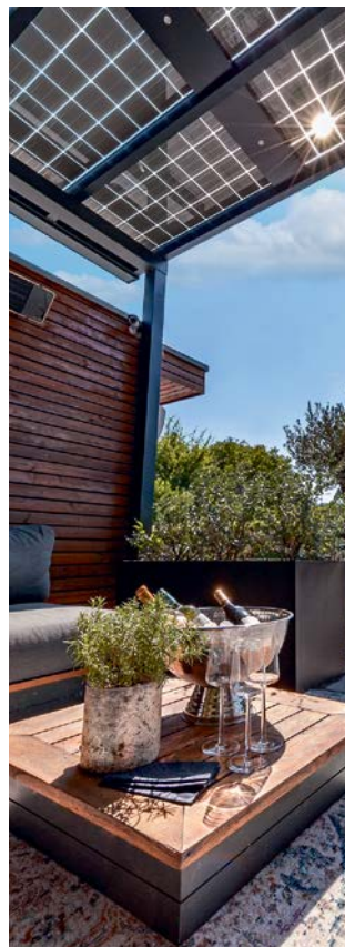
Eine Terrassenbedachung wird mit Solarelementen zum privaten Ökokraftwerk.

Viele Hauseigentümer entscheiden sich dazu, den gewonnenen Solarstrom so weit wie möglich selbst zu nutzen - entweder sofort oder mittels eines Batteriespeichers auch dann, wenn abends die Sonne nicht mehr scheint. Eine hohe Eigenverbrauchsquote rechnet sich, weil entsprechend weniger Energie aus dem öffentlichen Netz bezogen werden muss. Das spart bares Geld und macht gleichzeitig unabhängiger von der externen Versorgung sowie der zukünftigen Preisentwicklung. Neben gängigen Photovoltaik-Varianten für das Dach des Eigenheims bieten sich noch zahlreiche weitere Installationsorte an, an die viele Immobilienbesitzer spontan gar nicht denken würden.