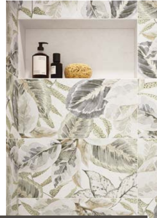
Große florale Muster bringen barocke Lebensfreude ins moderne Bad.

Weiß oder Beige als dominierende Grundtöne im Bad haben ausgedient. Wie in anderen Wohnbereichen auch, darf im Badezimmer ein individueller Wohnstil verwirklicht werden. Erlaubt ist, was gefällt. So bieten die Hersteller von Sanitärausstattung, Badmobiliar sowie Fliesen heute ein breit gefächertes Sortiment für jede Stilrichtung. Jens Fellhauer vom Bundesverband Keramische Fliesen e. V. rät, sich bei der Planung eines neuen Bads oder bei einer Modernisierung nicht an kurzlebigen Trends zu orientieren: „Am langlebigsten ist eine Badgestaltung, wenn Bauherren oder Sanierer die Einrichtung des neuen Bades an die eigene Persönlichkeit, ihre Nutzungsgewohnheiten sowie optische Vorlieben anpassen. Und sie sollten sich gezielt mit der Wand- und Bodengestaltung beschäftigen, denn diese Flächen entscheiden über die spätere Grundatmosphäre im neuen Bad.“