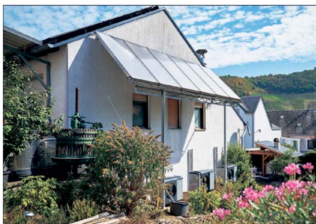
Mit einer Wärmepumpe können die Vorgaben des Gebäude-Energiegesetzes GEG problemlos erfüllt werden.

Um erneuerbare Energien zum Heizen nutzen zu können, braucht es zunächst das passende Heizsystem. Sowohl für Baufamilien als auch für Sanierer und Modernisierer kann die Wärmepumpe interessant sein. Sie nutzt die in der Umwelt gespeicherte Energie zum Heizen und lässt sich gleichzeitig gut mit Photovoltaik- und Solarthermieanlagen kombinieren. Zudem gibt es Wärmepumpen in