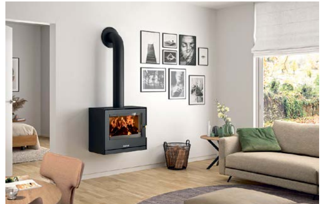
Feuer im Rechteck: an der Wand hängend, mit stabilem Fuß, auf kompakter Box oder schlanken Holzbeinen.

Die rechteckige Architektur des schwarzen Korpus aus Stahl setzt in jeder Wohnung markante Akzente. Während der „Dias“ über 70 Zentimeter breit ist, präsentiert sich die XL-Version in einer stattlichen Breite von über 90 Zentimetern. Bei beiden Versionen kann der extrabreite Feuerraum mit bis zu 50 Zentimeter langen Scheiten bestückt werden. Das hat gleich zwei Vorteile gegenüber den meisten Öfen, die nur für 33 Zen-