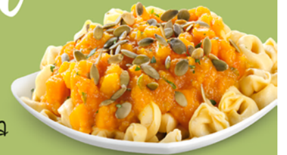
Tortellini con sugo alla zucca