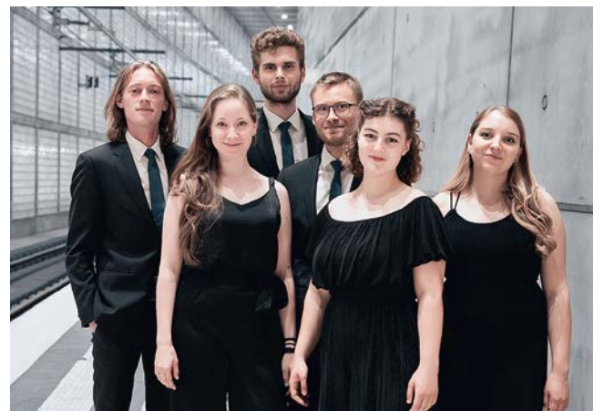
Die Kammerkonzerte legen um 18 Uhr mit dem Ensemble Voicemade aus Leipzig im Audienzsaal im Residenzmuseum Schloß Neuhaus los.

Für die Erwachsenen singt Voicemade. Das Vokalextekt hat seine Wurzeln in der für ihre hoch-