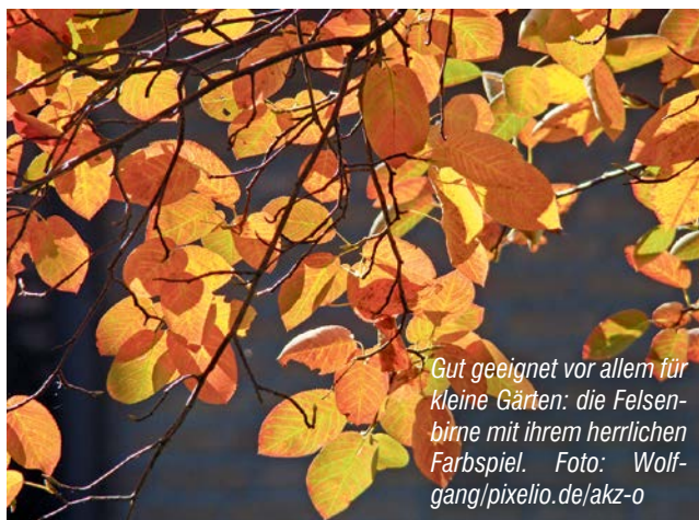
Gut geeignet vor allem für kleine Gärten: die Felsenbirne mit ihrem herrlichen Farbspiel.

3. Zeitpunkt: Die Herbstpflanzung sollte in der Regel bis Anfang No-