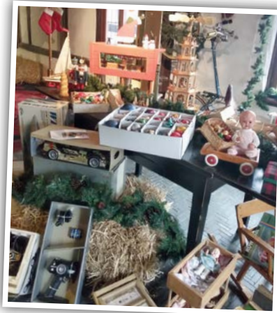
Beim Charity-Weihnachtsmarkt der AWO im frisch renovierten Adam-und-Eva-Haus warten am ersten Adventswochenende viele alte Schätze auf neue Besitzer

wein auch Weihnachtsmusik zum Mitsingen und täglich ab 14.00