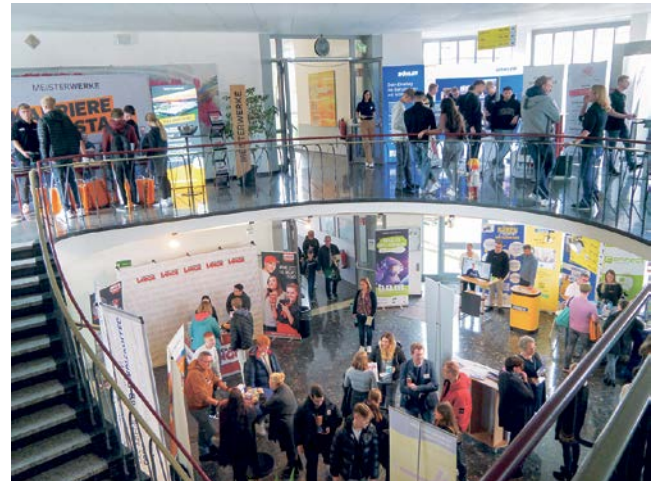
Die diesjährige Bürener Ausbildungsmesse im Ludwig-Erhard-Berufskolleg lockte wieder viele Besucherinnen und Besucher an, die in die vielfältigen Möglichkeiten der Berufswelt eintauchten.

Büren. Rund 60 regionale Unternehmen, mehr als 1.000 Jugendliche und unzählige Möglichkeiten, die zum Greifen nah sind – so lässt sich die 12. Bürener Ausbildungsmesse zusammenfassen, die am Wochenende vom 27. und 28. Oktober 2023 in den Räumlichkeiten des Ludwig-Erhard-Berufskollegs (LEBK) stattgefunden hat. In enger und vertrauensvoller Zusammenarbeit zwischen der Wirtschaftsförderung der Stadt Büren und dem LEBK wurde die Messe organisiert. Schirmherr war in diesem Jahr als langjährige Partnerin der Bürener Ausbildungsmesse die MeisterWerke Schulte GmbH aus Rüthen. Mit der Durchführung der Messe wurde – wie bereits in den Vorjahren – das Ziel verfolgt, jungen Menschen die Möglichkeit zu bieten, sich über Ausbildungs- und Studienangebote in der Region zu informieren und praxisnahe Einblicke in die Vielfalt heutiger Berufsbilder zu erhalten. Auch für die teilnehmenden Unternehmen ist die Messe jedes Mal ein Zugewinn: Sie haben die Option, sich und ihre Inhalte vorzustellen und potenzielle Nachwuchskräfte zu gewinnen – all das im Rahmen des persönlichen Gesprächs und einer lockeren Atmosphäre. „Die Resonanz zur 12. „b.a.m.“ ist durchweg positiv. Die beiden