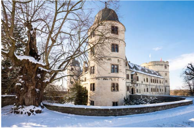
Weihnachtsmarkt in und an der Wewelsburg am Samstag, den 9. Dezember von 14 bis 20 Uhr.

Kreis Paderborn (krpb). Zum zweiten Mal findet im Kreismuseum Wewelsburg ein Weihnachtsmarkt statt. Beim Duft von Glühwein und Weihnachtsmusik lädt das einmalige Ambiente der beleuchteten Wewelsburg am Samstag, den 9. Dezember von 14 bis 20 Uhr zum Stöbern und Verweilen ein. Der „Adventsbasar“ präsentiert im Burgsaal „Wewelsburger Handwerkskunst“. Darüber hinaus kann man sich im Warmen bei Kaffee und Kuchen stärken. Für Kinder gibt es Bastelaktionen und Dosenwerfen. Der Tambourcorps und Musikverein Edelweiß e.V. musiziert in der Zeit von 15 bis 18 Uhr und das Maskottchen „Falko“ freut sich darauf, die kleinen und großen Gäste zu begrüßen. Für Essen und Trinken ist auch gesorgt: Das Bistro der Jugendherberge sowie die Gastronomie an der Wewelsburg sind geöffnet. Darüber hinaus gibt es am Burgvorplatz Bratwurst und Pommes, sowie warme und kalte Getränke. Im Burginnen-