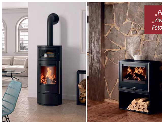
„Polar Neo Bakery“ und der neue „Ziva Cook“ machen Appetit auf mehr.

Geschmack, Genuss und viel Gemütlichkeit