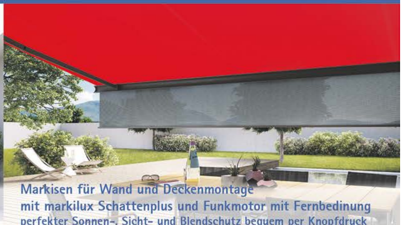
Markisen für Wand und Deckenmontage mit markilux Schattenplus und Funkmotor mit Fernbedingung perfekter Sonnen-, Sicht- und Blendschutz bequem per Knopfdruck

Pavillons, verdrehbar – Gewächshäuser in unserer Ausstellung