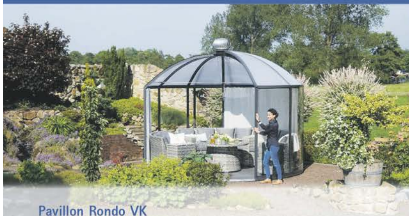
Pavillon Rondo VK

Pavillons, verdrehbar – Gewächshäuser in unserer Ausstellung