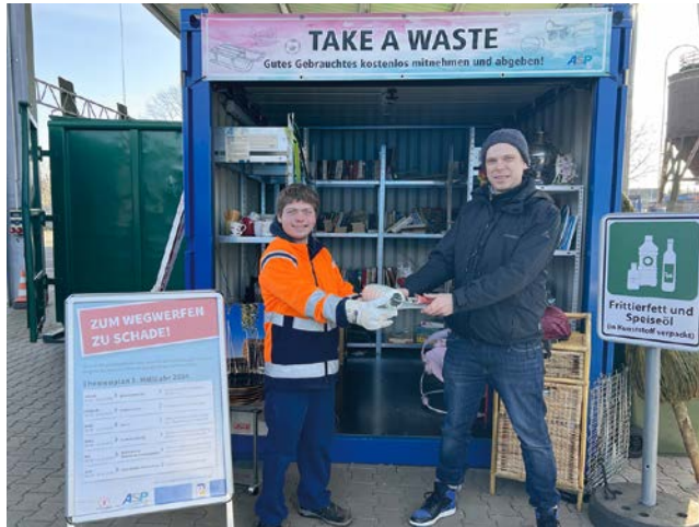
Ein Mitarbeiter auf dem Recyclinghof nimmt die Ware für die Aktion Lieblingsstücke an.

Die Ware wird über einen gewissen Zeitraum gesammelt und dann an das Sozialkaufhaus „Lieblingsstücke“ in der Friedrich-List-Straße 23 übergeben. Dort werden die Gegenstände für einen kleinen Preis allen Kund*innen angeboten. Es profitieren besonders Menschen mit wenig Geld von der Aktion. Sie können hier gebrauchte