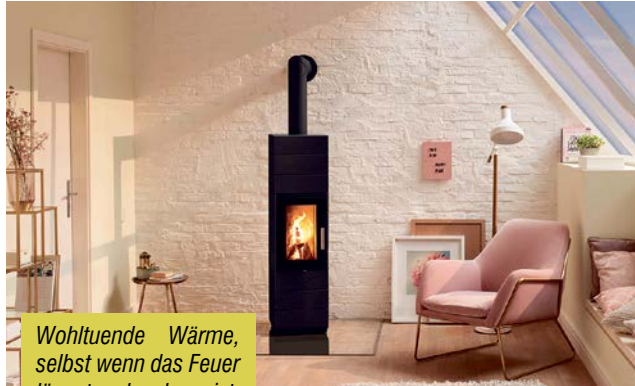
Wohltuende Wärme, selbst wenn das Feuer längst erloschen ist.

oder später nachbestellt werden kann. Dieser besteht aus drei 15 kg Gusspeichereinlagen und einem zusätzlichen Corna-Element, mit dem das Gerät erweitert werden kann. Die Speicherelemente werden während des Abbrandes aufgeladen und geben die gespeicherte Wärme zeitverzögert an den Raum ab und verlängern so die Heizleistung. Je nach Ausführung besteht der mattschwarze Kaminofen standardgemäß aus fünf bzw. sechs Elementen, die gemeinsam eine schlanke, kubistische Säule auf einer Grundfläche von nur 38 x 38 cm bilden: Unten sind drei oder vier Gusselemente, darüber der Brennraum und oben nochmals zwei Elemente. Die Gusspeicheroption er-