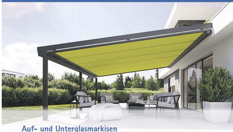
Auf- und Unterglasmarkisen

Markisen von markilux , Vielfalt des Sonnenschutzes