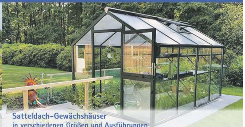
Satteldach-Gewächshäuser in verschiedenen Größen und Ausführungen

Beratung vor Ort – Angebote und Zeichnungen kostenlos!