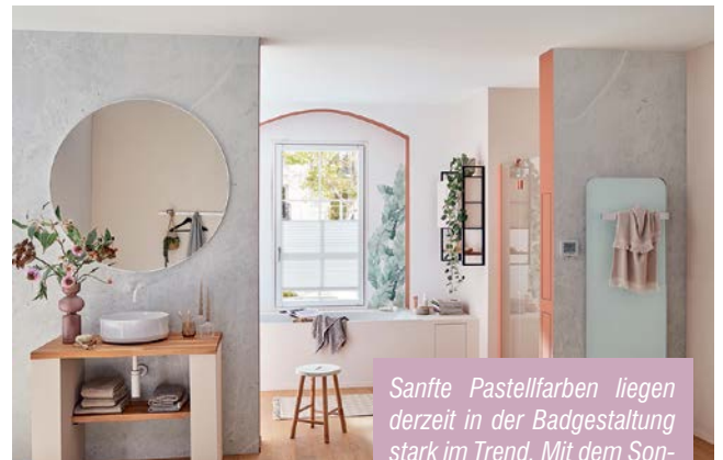
Sanfte Pastellfarben liegen derzeit in der Badgestaltung stark im Trend. Mit dem Sonderprogramm KermiEXTRA können die Duschkabinen farblich passend zum Badambiente gestaltet werden.

Ein zartrosa Traum entsteht mit der Sanitärfarbe „Noble Pink“ aus der Edition Nature, die der Duschkabine einen romantischen Look verleiht. So wie im abgebildeten Badezimmer, ausgestattet mit der LIGA Schwingtür. Diese wirkt durch ihr schmales Wandprofil und die dezenten Beschläge sehr transparent und die Gestaltung in