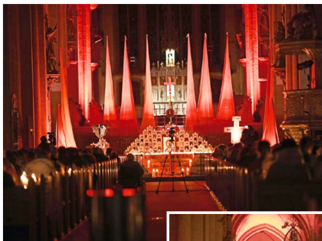
Am 23. Februar 2024 wird im Hohen Dom zu Paderborn von 20 bis 22 Uhr die 22. Nacht der Lichter gefeiert.

Paderborn (pdp). Am Freitag, 23. Februar 2024, wird im Hohen Dom zu Paderborn von 20 bis 22 Uhr die 22. Nacht der Lichter gefeiert. Der meditativ gestaltete Gottesdienst unter dem Leitwort „Seid heilig, denn ER ist heilig“ (Lev 19,2) stellt in diesem Jahr Gedanken über das Heiligsein in den Mittelpunkt. Zu der von Kerzenlicht und den Gesängen aus der ökumenischen Gemeinschaft von Taizé geprägten Feier sind alle Menschen eingeladen – besonders auch Jugendliche. Organisiert wird die Veranstaltung von der Abteilung Jugend/Junge Erwachsene im Erzbischöflichen Generalvikariat Paderborn, der Diözesan-Kolpingjugend und dem Jugendhaus Hardehausen.