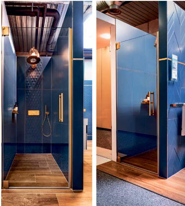
Kermi Duschcabine sind in sehr vielen Ausstellungen vertreten. Mit der Kermi Fachpartnersuche ist die gewünschte Duschkabine schnell gefunden und man kann sich zudem inspirieren lassen. Wie hier die Pasa Duschkabine mit Akzenten in edlem Heliosgold.

Sie möchten zuhause ein neues Bad realisieren oder das bestehende umbauen? Dann kann Kermi dabei helfen, dafür die notwendigen Fachpartner zu finden. Und zwar mit der schnellen und übersichtlichen Fachpartnersuche auf der Kermi Homepage www.kermi.de . Die Planung eines neuen Badezimmers erfordert eine sorgfältige Überlegung. Für die Auswahl der Produkte ist es ratsam, sich diese live in einer Ausstellung anzuschauen. Man erhält eine ausführliche Beratung und kann sich inspirieren lassen. Kermi Duschcabine sind deutschlandweit in sehr vielen Ausstellungen vertreten. Wo genau? Das verrät die Fachpartnersuche auf der Kermi Homepage mit nur wenigen Klicks. Und auch ein zuständiger Fachbetrieb, der das neue Bad plant, berät und letztendlich auch den Einbau vornimmt, ist damit sehr schnell gefunden.