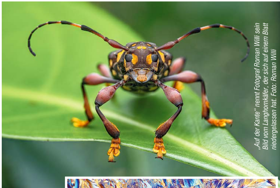
„Auf der Kante“, nennt Fotograf Roman Willi sein Bild vom Langhornkäfer, der sich auf einem Blatt niedergelassen hat.

Paderborn-Schloß Neuhaus. Die Siegerbilder von 20.000 eingesandten Naturfotos zeigt der Naturfotografen-Wettbewerb „Glanzlichter 2023“ ab dem kommenden Sonntag, dem 18. Februar im Naturkundemuseum in Schloß Neuhaus. Insgesamt 87 preisgekrönte Aufnahmen aus allen Bereichen der Naturfotografie haben es in die