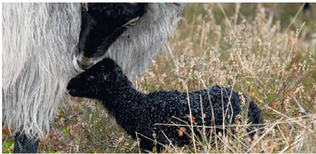
Frisch geborenes Heidschnuckenlammchen in der Heide.