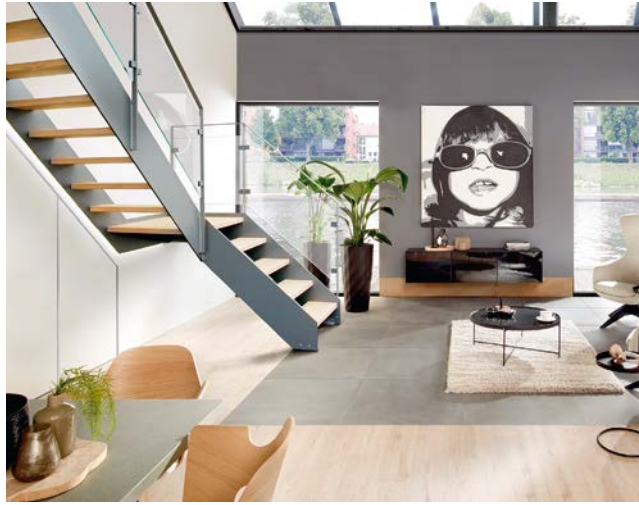
Blickfang Loft-Treppe: Die Wangen aus Verbundwerkstoff können farblich individuell gestaltet werden.