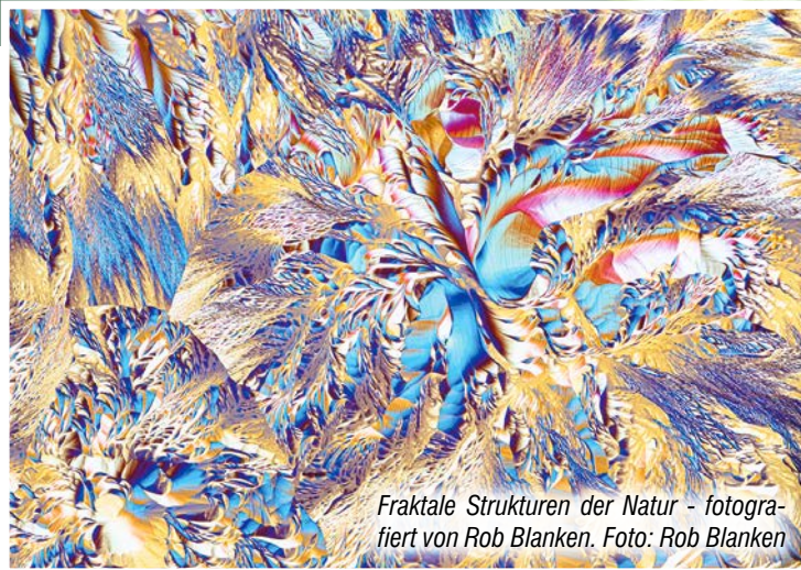
Fraktale Strukturen der Natur - fotografiert von Rob Blanken. Foto: Rob Blanken

Paderborn-Schloß Neuhaus. Die Siegerbilder von 20.000 eingesandten Naturfotos zeigt der Naturfotografen-Wettbewerb „Glanzlichter 2023“ ab dem kommenden Sonntag, dem 18. Februar im Naturkundemuseum in Schloß Neuhaus. Insgesamt 87 preisgekrönte Aufnahmen aus allen Bereichen der Naturfotografie haben es in die