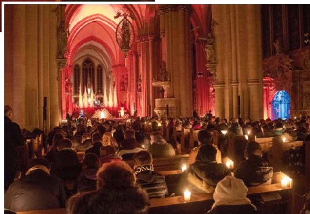
Zur Nacht der Lichter im Paderborner Dom kommen jeweils bis zu 1.000 Menschen aus dem gesamten Erzbistum Paderborn, bewegt und berührt von der meditativen Atmosphäre aus Licht und Gesang.