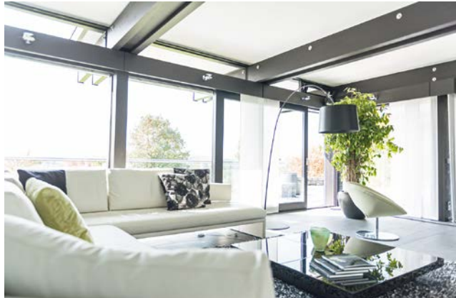
Glas ist ein prägendes Element moderner Architektur. Innen- und Außenbereich gehen so fließend ineinander über.

Ohne Glas geht es nicht in der zeitgemäßen Architektur: Groß dimensionierte Scheiben und Schieberegeln lassen den Wohnbereich