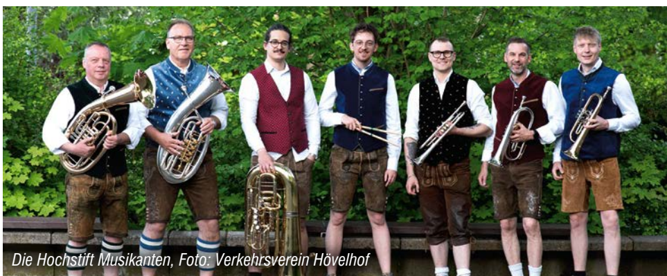
Die Hochstift Musikanten

Rechtzeitig zum Maibaum- und Radelfest erscheint die neue Auflage der Radbroschüre, und na-