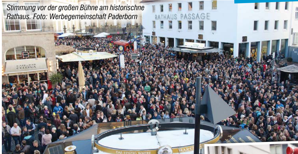
Stimmung vor der großen Bühne am historische Rathaus.

ten und DJs erobern gerade in rasanter Geschwindigkeit die Welt. Sie stehen für eingängige und tanzgetriebene Vibes, gepaart mit melancholischem Gesang und einem gefühlvollen Touch.