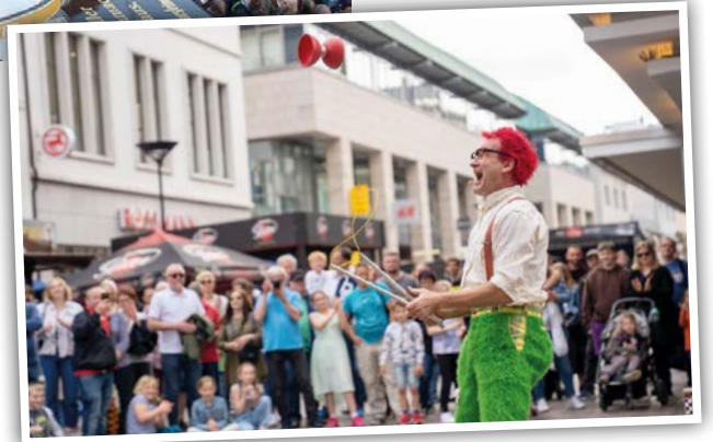
Walk-Acts und Kleinkunst gibt es in der gesamten Fußgängerzone.

Loungemusik mit Drinks, Snacks und Süßem werden am Samstag und Sonntag ab 21:00 Uhr Kopfhörer für die erste Silent-Party verteilt. Jeder lauscht dann auf unterschiedlichen Kanälen der Musik von drei DJs – je nach seinem Geschmack! Zuschauer dürfen sich dann wundern. Man hört nur das Getrappel der tanzenden Füße und vielleicht des Mitsummen einiger Musikfans. Bei buntem Licht und Strobo-Light entsteht so eine magische Atmosphäre.