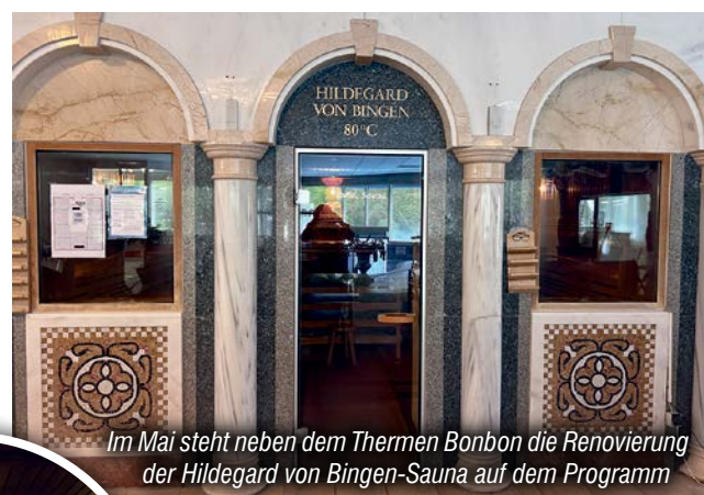
Im Mai steht neben dem Thermen Bonbon die Renovierung der Hildegard von Bingen-Sauna auf dem Programm