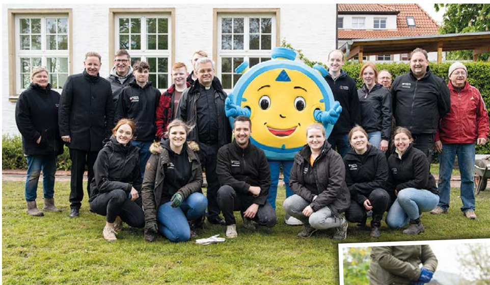
In Salzkotten angekommen, griff Erzbischof Dr. Udo Markus Bentz kurzerhand selbst zu Handschuhen und Pflasterhammer und half mit beim Steineverlegen.

Paderborn (pdp). 72 Stunden im Einsatz – mit anderen und für andere: Die 72-Stunden-Aktion des Bundes der Deutschen Katholischen Jugend (BDKJ) legt auch in diesem Jahr wieder den Grundstein für eine bessere Welt. So auch die Kolpingjugend in Salzkotten. Als eine von 162 Aktionsgruppen im Erzbistum Paderborn hat sie das Außengelände der Simonschule in Salzkotten verschönert und dabei einen tatkräftigen Unterstützer für sich gewonnen: Dr. Udo Markus Bentz. Der neue Erzbischof griff kurzerhand selbst zu Handschuhen und Pflasterhammer und half mit beim Steineverlegen.