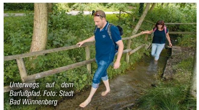
Unterwegs auf dem Barfußpfad.

Bad Wünnenberg. Der etwa einen Kilometer lange Barfußpfad hat den Kurort zu Füßen der Aabachtalsperre weithin bekannt gemacht. Hier heißt es: Schuhe und Strümpfe aus - Freiheit für die Füße! Was zu Beginn noch ungewohnt erscheint entwickelt sich schon nach kurzer Zeit zu einem vitalisierenden Erlebnis. Vor allem wenn man es öfters tut. Regelmäßiges Barfußgehen kräftigt die Fuß- und Unterschenkelmuskulatur und beugt somit Fuß- und Haltungsschäden vor. Vor allem für eine gesunde Entwicklung von Kinderfüßen ist das Barfußlaufen wertvoll, denn es ist die