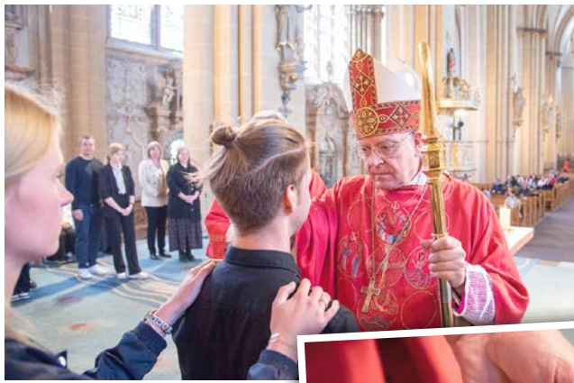
Weihbischof Matthias König spendet am kommenden Samstag Erwachsenen aus dem Erzbistum im Paderborner Dom das Firmsakrament.

Paderborn (pdp). Aus verschiedenen Regionen des Erzbistums kommen Erwachsene am Samstag, 25. Mai 2024, nach Paderborn, um das Sakrament der Firmung zu empfangen: Weihbischof Matthias König spendet den jüngeren und älteren Frauen und Männern am Samstag nach dem Pfingstfest in einem festlichen Gottesdienst in der Bischofskirche des Erzbistums das Firmsakrament. Der Gottesdienst beginnt um 10.30 Uhr. Zu den erwachsenen Firmlingen, die am kommenden Samstag das Sakrament empfangen, gehören Frauen und Männer, die den christlichen Glauben angenommen haben und erst vor kurzem getauft wurden. Darunter sind ebenso Christen, die als Kind getauft wurden und den Glauben jetzt wieder leben und dazu auch das Firmsakrament empfangen möchten. „Firmung ist Sendung und Stärkung“, unterstreicht Weihbischof Matthias König. Durch die Firmung werde der Einzelne beauf-