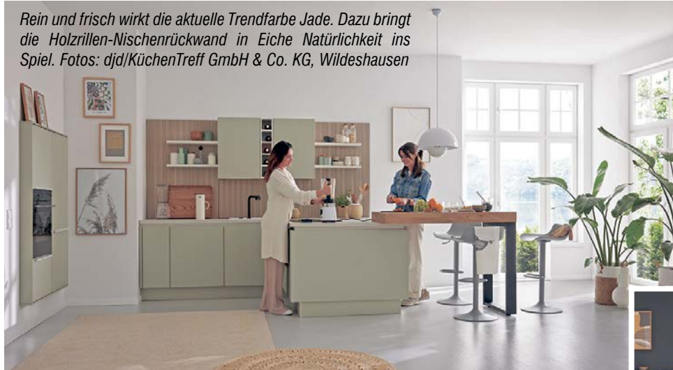
Rein und frisch wirkt die aktuelle Trendfarbe Jade. Dazu bringt die Holzrillen-Nischenrückwand in Eiche Natürlichkeit ins Spiel.

Allen technischen Raffinessen zum Trotz: Die Farbe ist das Erste, was einem beim Anblick einer Küche ins Auge fällt. Sie soll ein gutes Gefühl vermitteln, lange Freude machen und – gerade bei offenen Wohnkonzepten – auch zur restlichen Einrichtung passen. Lange dominierte das neutrale Weiß die Kücheneinrichtungen, in den letzten Jahren waren dagegen vielfach sehr dunkle Fronten angesagt. Jetzt geht der Trend wieder in Richtung hell: Sanfte Pastelltöne bringen auf dezente Weise Farbe in die Küche und sind genau richtig für ein kreatives und frisches Design.