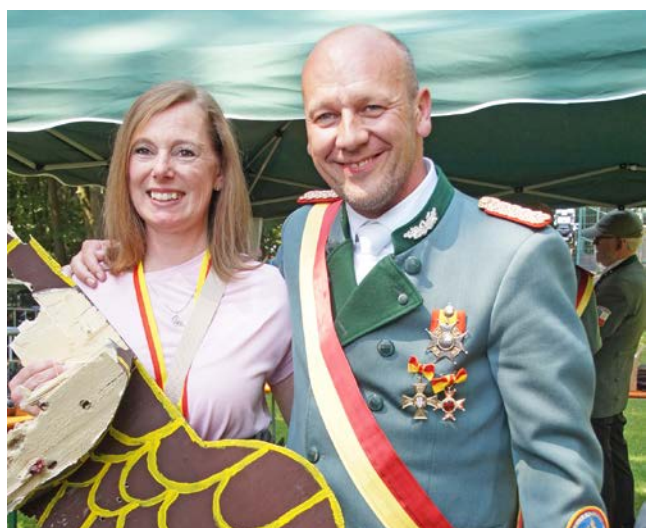
Ehefrau Monika ist unter den ersten Gratulanten.

Bauer. Dritter Schütze im Bunde war Hans-Jürgen Kallenberg. Alle drei Anwärter kamen von der Königsträßer-Kompanie. Damit stellt diese Kompanie seit 2018 erstmals wieder einen Schützenkönig. Sascha Koch ist der 166. Schützenkönig des PBSV. Eine besondere Freude machte er mit sei-