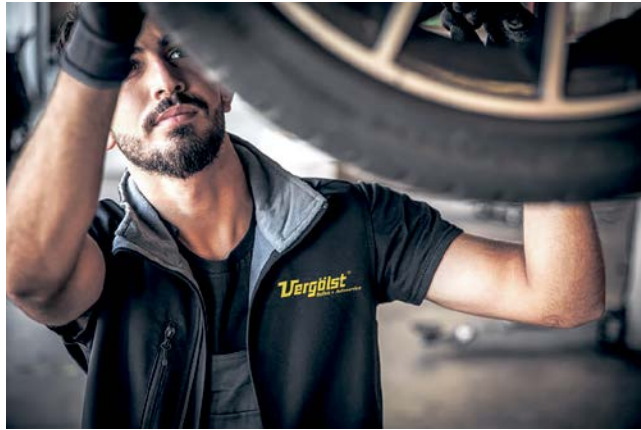
Ist die Bereifung noch in gutem Zustand? Gerade vor längeren Fahrten empfiehlt sich ein prüfender Blick durch den Werkstattfachmann.

Bad Lippspringe. Die Koffer sind gepackt, Spielzeug für die Kids, genügend Sonnencreme und Urlaubslektüre liegen parat: Unbeschwertes Ferienwochen steht kaum noch etwas im Weg. Bevor sich die Familie auf große Fahrt zum Urlaubsziel begibt, sollte man allerdings dem Auto einen kurzen Boxenstopp in der Fachwerkstatt gönnen.