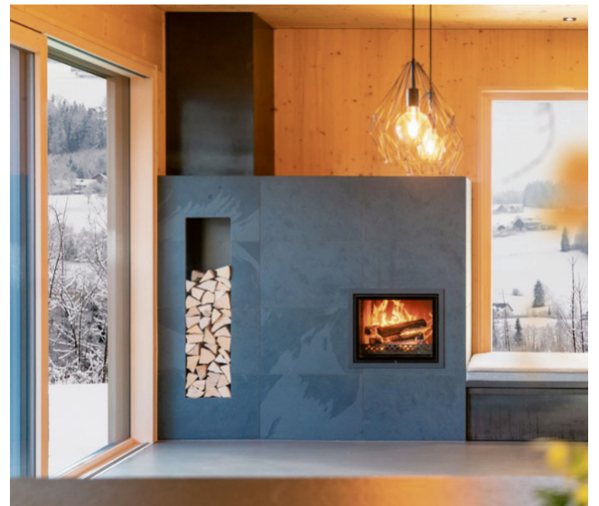
Holzfeuerstätten wie Speichergrundöfen mit Wasserwärmetauscher können auch eine Wärmepumpe ideal ergänzen und entlasten.

zeichnen sich nicht nur durch niedrigere Emissionen, sondern auch durch höhere Effizienz aus. Sie tragen aktiv zur Reduktion von Feinstaub und Kohlenmonoxid bei und nutzen den nachwachsenden Rohstoff Holz. Geräte wie wasserführende Kachelöfen, Heizkamine, Kamin- oder Pelletöfen können zudem an zentrale Heizsysteme angeschlossen werden. Sie lassen sich auch mit Wärmepumpen kombinieren und leisten so einen Beitrag zur Warmwasserbereitung und Gebäudebeheizung. Für viele Verbraucherinnen und Verbraucher ist dies eine attraktive Möglichkeit, sich unabhängiger von fossilen Brennstoffen zu machen.