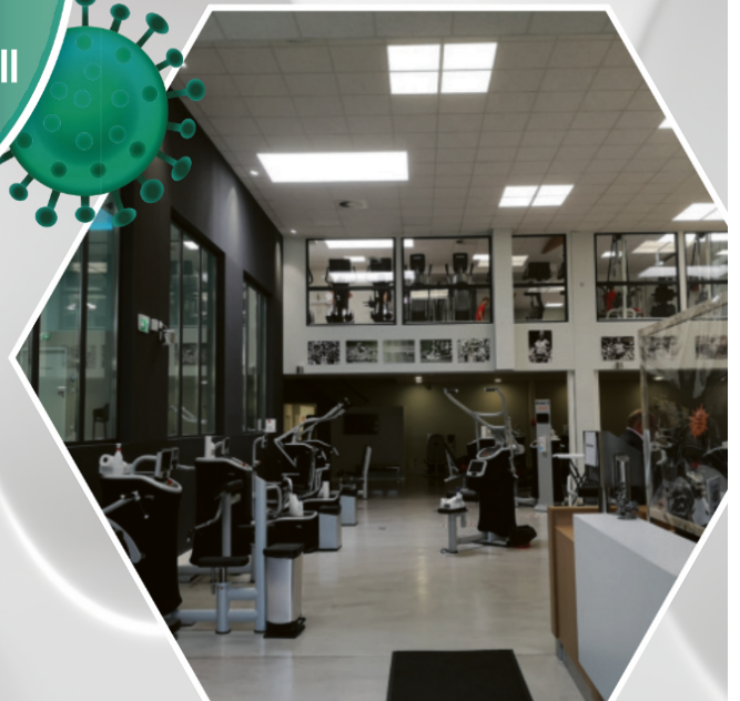
Fitness Studio Lange Fit in Höxter mit antibakterieller Wandbeschichtung