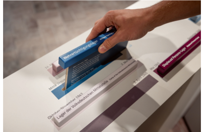
Der neue GeDenkOrt ist am Samstag, den 18. Januar von 14 bis 17 Uhr geöffnet.

Kreis Paderborn (krpb). Am kommenden Samstag können sich Interessierte von 14 bis 17 Uhr im neuen GeDenkOrt der Erinnerungs- und Gedenkstätte Wewelsburg 1933 – 1945 des Kreismuseums Wewelsburg informieren. Dabei geht es um unterschiedliche Formen der Zwangsmigration im 20. Jahrhundert am Beispiel des Dorfs Wewelsburg sowie um den Umgang mit den baulichen Überresten ehemaliger NS-Verbrechensorte. Jeweils um 14 Uhr und 15:30 Uhr werden historische Einführungen zur Baugeschichte des ehemaligen KZ-Gebäudes und zur neuen Ausstellung gegeben. Der GeDenkOrt befindet sich im Seitentrakt der ehemaligen Häft-