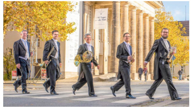
Das Blechbläserquintett Symphonic Brass kommt vom Landestheater Detmold und bringt einen Streifzug durch Blechbläser-Arrangements mit.

Paderborn. Das Ensemble Symphonic Brass zeigt im Audienzsaal im Residenzmuseum Schloß Neuhaus, was Brass alles kann. Unter dem Titel „Brass, Baroque & Opera“ spielen die fünf Blechbläser aus dem Symphonischen Orchester des Landestheaters Detmold am Sonntag, 2. Februar, um 18 Uhr auf Einladung des Kulturamts der Stadt Paderborn. Auf dem Programm stehen Arrangements bekannter Orgelwerke von Johann Sebastian Bach, darunter die berühmte „Kaffeewasserfuge“ in g-Moll, berühmte Stücke aus dem Opernrepertoire (Ouvvertüren zu Mozarts „Zauberflöte“ und Rossinis „Barbier von Sevilla“) und aus dem 20. Jahrhundert die Dreigroschenoper-Suite und ein Potpourri aus „Die lustige Witwe“.