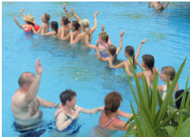
Viel Spaß verspricht ein Junggesellinnenabschied in der Weser-Therme, Bad Karlshafen.

Bad Karlshafen. Kalte Witterung ist Thermenzeit und so können sich Thermenfans auch in diesem Jahr vom 6. bis 16. Februar 2025 mit dem ersten „Thermen Bonbon“ des Jahres in der Weser-Therme, Bad Karlshafen, eindecken, sich gemütliche Stunden in der warmen Thermalsole gönnen. Gleich 2 Gratisgutscheine erhält man beim Kauf einer Zehnerkarte zusätzlich. Neben den vierteljährlichen