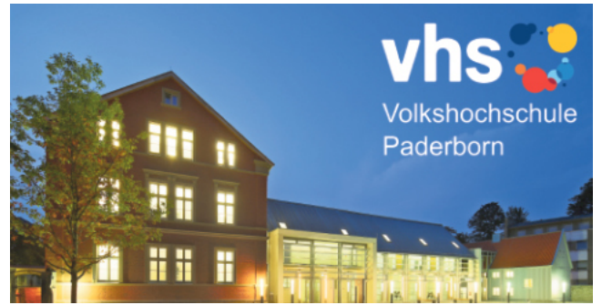
Im Februar starten in der vhs Paderborn zahlreichen Fremdsprachen-Angebote.

Der Fachbereich Fremdsprachen der Volkshochschule Paderborn heißt alle Sprachinteressierten zum Frühjahrsemester herzlich willkommen. Die attraktive Palette an fremdsprachlich-kulturellen Angeboten ist dabei auch in diesem Semester wieder groß und umfasst aktuell 15 verschiedene Fremdsprachen. Wer gerne seine vorhandenen Sprachkenntnisse auffrischen, eine neue Fremdsprache erlernen oder sich gerne wieder einmal mit anderen persönlich in einer Fremdsprache austauschen möchte, hat ab Anfang Februar die Möglichkeit, an vielfältigen Sprachangeboten der vhs teilzunehmen. Neben den klassischen großen Sprachen Englisch, Französisch, Spanisch und Italienisch stehen diesmal auch Angebote in Arabisch, Japanisch, Koreanisch, Neugriechisch, Niederländisch, Polnisch, Portugiesisch, Russisch, Schwedisch, Türkisch und sogar Finnisch auf dem Programm. Die Palette der Kursformate umfasst dabei Kurse während des Tages und Abendkurse, die in der Regel einmal oder zweimal pro Woche stattfinden. Ebenso gibt es Intensivwochen, Bildungsurlaube und Ferienkurse. Weitere Online-Kurse regionaler Kursleitungen runden das