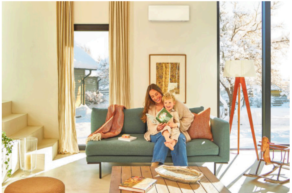
An heißen Sommertagen sorgen Klimaanlage für angenehme Temperaturen im Inneren. Im Winter können sie bestehende Gas- oder Ölheizungen ergänzen und so viel Geld sparen.