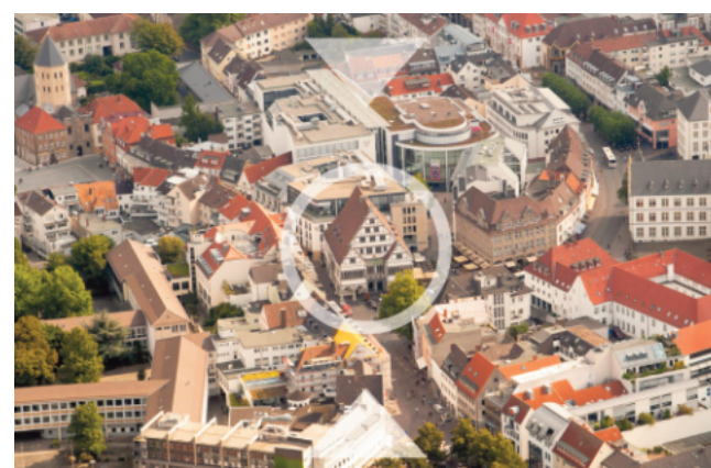
Im Paderborner Rathaus wurde am Donnerstagabend der Haushalt für das Jahr 2025 verabschiedet. Nun steht noch die Genehmigung des Kreises aus.

Mit einem Gesamtaufwandsvolumen von rund 658,8 Millionen Euro han-