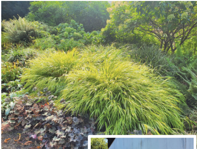
Was für eine Wucht: Japanwaldgras ( Hakonechloa macra ) umrahmt von Stauden.

Groß ist die Sehnsucht nach sommerlicher Wärme und nach viel Zeit draußen im Garten. Wenn es aber erstmal ein paar Wochen heiß und trocken war, dann blickt man möglicherweise anders auf den Rasen und auf die Blumenbeete. Wir wissen noch nicht wie dieser Sommer wird, aber wenn er sich an den Trend hält, dann dürfte auch er wieder zum Schwitzen sein und wenn wir schwitzen, dann haben viele Pflanzen im Garten Stress. Schotter und Steine ums Haus sind keine Option, denn sie heizen sich an heißen Tagen erst recht auf und geben in der Nacht, in der wir es gern zum Schlafen etwas kühler haben würden, die Hitze wieder ab. Dagegen hilft nur Schatten und eine lebendige Bepflanzung - die muss gar nicht so knallbunt sein, um zur Verdunstung beizutragen. Hobbygärtner, die sich nicht von ihrem Garten diktieren lassen wollen, wann sie zuhause bleiben müssen, um zu gießen, setzen auf robuste Pflanzen und neben schattenspendenden Gehölzen auf eine gesunde Mischung aus Gräsern und Stauden. Die Stauden sorgen für Farbe, Abwechslung und Blickfang und die Gräser sorgen mit ihren bodendeckenden Horsten dafür, dass die Erde nicht schnell austrocknet. Dazu gibt es eindrucksvolle Ähren, friedrige Büschel, zauberhafte Dolden