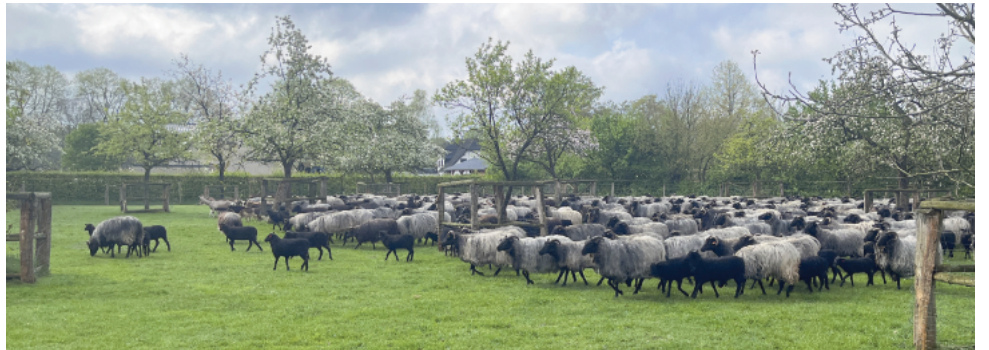
Heidschnucken und ihre Lämmer bei einem Ausflug auf die Obstwiese an der Heidschnucken-Schäferei.

Hövelhof. Die Heidschnucken-Schäferei Senne der Biologischen Station Kreis Paderborn – Senne e.V. öffnet zur Lammzeit 2025 ihre Türen. Große und kleine Leute können an den Samstagen 15. Februar sowie 1. und 15. März 2025 ohne Anmeldung zwischen 11 und 16 Uhr vorbeischaun und einen Einblick in die Kinderstube der Heidschnucken bekommen. Fachkundiges Personal steht für Fragen und Gespräche zur Verfügung und berichtet über die Aufgabe der Landschaftspflege durch die Tiere. Heidschnucken-Produkte wie