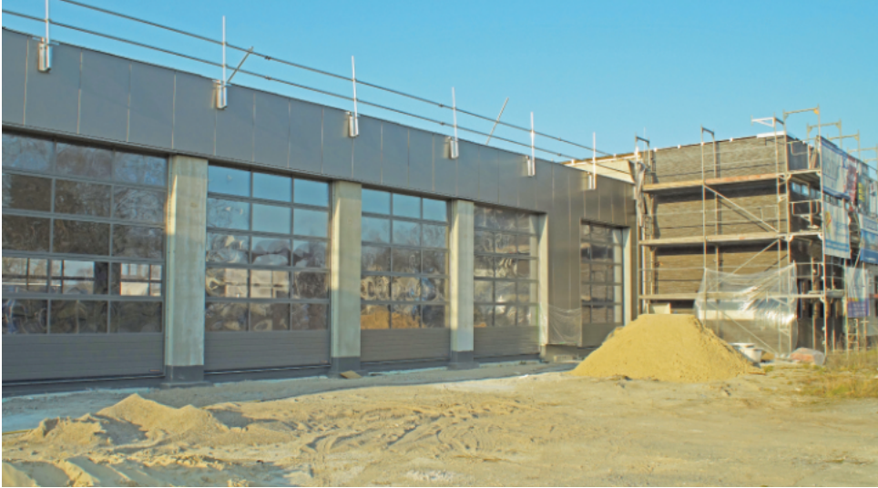
Die großen Rolltore der Fahrzeughalle sind bereits installiert.

dem Schützenfest und dem Stadt- fest.“ Näher möchte sich das Stadt- oberhaupt momentan noch nicht festlegen. Fest steht, dass es dann mit der Enge im alten Gerätehaus in der Wilhelm-Hücker-Straße vorbei ist. Gerne hätte man noch größer gebaut, aber auch die verfügbaren Finanzen spielen eine entscheidende Rolle. Insgesamt werden die Investitionskosten mit 7,3 Millionen Euro veranschlagt. Kurz vor Baubeginn war diese Summe nochmals gestiegen, eine umfassende, zeitgemäße Ener-