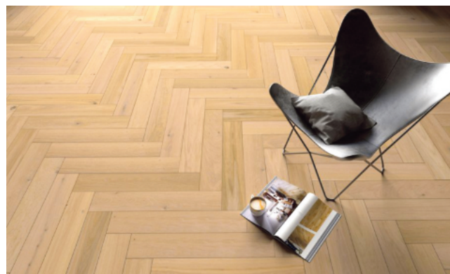
Echtes Parkett, hier im klassischen Fischgrät-Muster, steht für Natürlichkeit und Langlebigkeit.

Wer bei Vinylböden nur an preiswerte Materialien wie früher von der Rolle denkt, der irrt. Heutige Vinylböden bringen als hochwertige Klick-Variante viele Vorteile für unterschiedliche Anwendungen mit sich. "Aufgrund der Materialeigenschaften lässt sich Vinyl quasi überall verlegen, sogar in Bad und Dusche. Die Oberfläche ist angenehm fußwarm und rutschhemmend", erklärt Marcus Braunschauen von Türenheld.de. Ein weiterer Vorteil: Robuste und pflegeleicht Vinylböden gibt es in vielen verschiedenen Designs, von Holzoptik bis zum Fliesenlook. Wegen dieser Vielfältigkeit wird Vinyl häufig auch als Designboden bezeichnet. Tipp: Beim Kauf auf eine integrierte Trittschalldämmung achten.