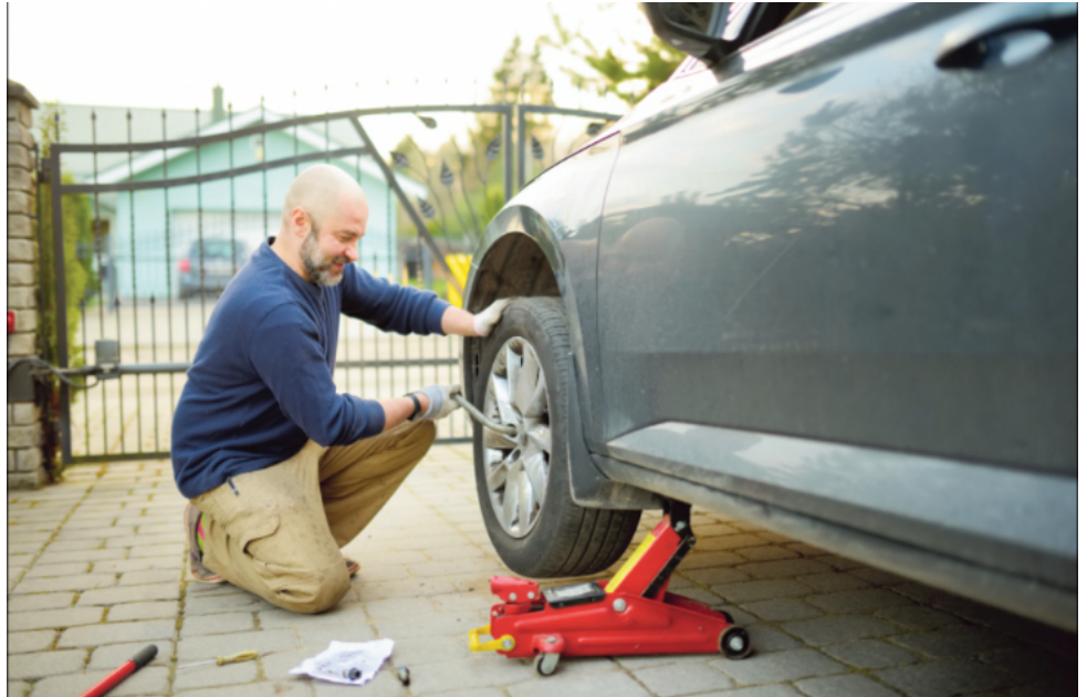
Die Reifen selbst zu wechseln, scheint auf den ersten Blick eine preiswerte Lösung zu sein. Privatpersonen verfügen in der Regel aber weder über Drehmomentschlüssel noch über Geräte zur Erkennung von Unwuchten – beides ist für den fachgerechten und sicheren Radwechsel unverzichtbar.

Paderborn. Die Reifen sind die einzige Verbindung zwischen Auto und Straße – und diese Verbindung ist kleiner, als viele denken. Die Standfläche eines Reifens entspricht in etwa der Größe einer Postkarte. Das bedeutet, dass selbst bei einem schweren SUV alle vier Reifen zusammen eine Aufstandsfläche haben, die nicht größer ist als ein DIN-A4-Blatt. Bei hohen Geschwindigkeiten, in Kurven oder beim plötzli-