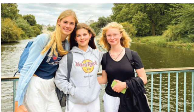
Während einer Sprachreise schließen Jugendliche schnell neue Freundschaften.

Der offensichtlichste Vorteil einer Feriensprachreise ist der Spracherwerb. Eine Sprache lernt man am besten in dem Land, in dem sie gesprochen wird. Während des Sprachurlaubs haben die Jugendlichen regelmäßig Sprachunterricht, zudem müssen sie sich auch außerhalb der Schule auf der Fremdsprache verständigen - sei es an der Supermarktkasse oder beim Frühstück mit der Gastfamilie. Veranstalter wie Panke Sprachreisen legen dabei großen Wert darauf, die Jugendlichen nur bei wichtigen Themen außerhalb