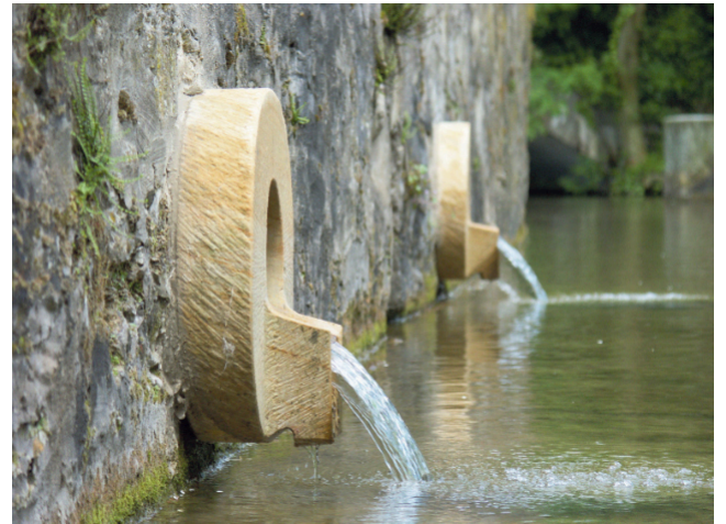
Die Paderborner Bewerbung „Stadt. Mensch. Fluss. – Die Pader für Europa“ um das Europäische Kulturerbe-Siegel ist eine Runde weiter: die Europäische Kommission veröffentlichte eine Liste der 21 Kandidaten aus 15 Mitgliedsstaaten, die es in die Vorauswahl geschafft haben. Die Bekanntgabe der finalen Auswahlentscheidung ist für den 1. März 2026 geplant, wie die Stadt Paderborn aus dem Ministerium für Kultur und Wissenschaft des Landes Nordrhein-Westfalen erfuhr.

Die Stadt Paderborn bewirbt sich mit ihrer einzigartigen urbanen Flusslandschaft als Teil des bedeutenden Erbes der Wasserkultur Europas um das Europäische Kulturerbe-Siegel 2025. Wie über Jahrhunderte Wasser in der Stadt genutzt wurde, welche technischen Innovationen dies europaweit nach sich gezogen hat, ist die Erzählung des Erbes der Wasserkultur Paderborns.