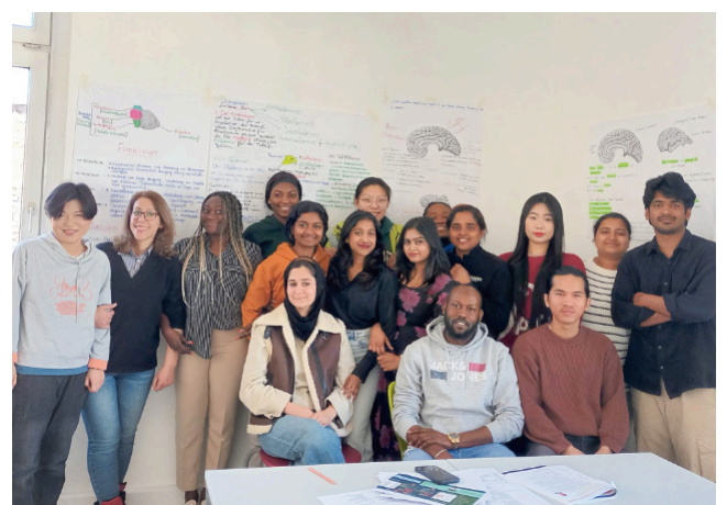
Die Teilnehmenden des laufenden Kurses 'Pflegefachfrau/-mann mit Deutsch als Fachsprache' vertiefen ihr Fachwissen am Bildungscampus St. Johannisstift.

Dieses besondere Ausbildungsprogramm richtet sich an Menschen mit einem Herkunftsland außerhalb der EU, die für eine Pflegeausbildung nach Deutschland kommen oder sich bereits hier aufhalten. Die Ausbildung folgt den gesetzlichen Vorgaben und dem schulinternen Curriculum. Ergänzend wird gezielter Deutschunterricht angeboten, der sich in drei Bereiche gliedert: Leben in Deutschland – Orientierung im Alltag und gesellschaftliche Integration, Strukturen des Gesundheitswesens – Aufbau und Abläufe in Pflege- und Therapieeinrichtungen, Fachsprache