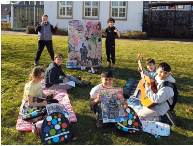
Bereit, um ihren persönlichen Kulturrucksack zu packen – Jugendliche aus Salzkotten stöbern im neuen Kulturrucksack-Programm.

Zum ersten Mal aber haben sie auch Workshops im Gepäck, die sich an Kinder und Jugendliche richten, die das Schreiben, das Musik machen in einer Band oder auch das Filmen längerfristig zu ihrem Hobby machen möchten. Diese Angebote finden in einem regelmäßigen Rhythmus auch außerhalb der Ferienzeit statt. Im Kulturrucksack-Ferienprogramm finden Kinder und Jugendliche Angebote aus den unterschiedlichsten Bereichen wie zum Beispiel dem Upcycling, Malen, Zeichnen, Podcasten und Entstehen von Hörspielen. Mit dabei ist auch das Filmen und Fotografieren, Graffiti sprühen, Theater spielen, das kreative Schreiben, Programmieren, Musi-