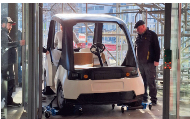
Neues Exponat fürs Stadtmuseum: Ein Prototyp für autonomes Fahren zählt nun auch zur Ausstellung „Einsteigen bitte! 125 Jahre öffentlicher Nahverkehr in Paderborn“.

Paderborn. Die Ausstellung „Einsteigen bitte! 125 Jahre öffentlicher Nahverkehr in Paderborn“, die aktuell im Paderborner Stadtmuseum zu sehen ist, ist um ein weiteres Exponat reicher: Hierbei handelt es sich um einen Prototyp für autonomes Fahren von INYO Mobility, den die Besucher*innen nun ganz genau betrachten können. Der Prototyp wurde vom Verein Neue Mobilität (NeMo) zur Verfügung gestellt. Dieser verfolgt das Ziel, ein ganzheitliches und nachhaltiges Mobilitäts-ökosystem zu entwickeln. Seinen Ursprung hat NeMo an der Universität Paderborn, wo erste Forschungsprojekte und interdisziplinäre Kooperationen die Basis für die heutige Initiative legten. Aus diesem Umfeld heraus ist ein starkes Netzwerk entstanden, das Entwickler*innen, Anwender*innen sowie Nutzende innovativer Lösungen miteinander verbindet. Gemeinsam werden so die Grundlagen für eine zukunftsweisende Mobilität geschaffen, die ökologisch, ökonomisch und sozial tragfähig ist. Mit NeMo.bil hat NeMo ein wegwei-