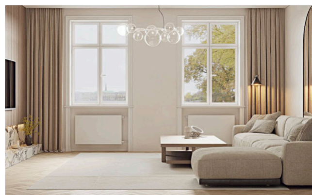
Ein neuer, weißer Anstrich bringt abgewohnte Wände unkompliziert und schnell wieder zum Strahlen.

Dabei handelt es sich um sogenannte Nieder- und Tieftemperaturheizkörper mit einem Wärmetauscher aus ultraleitfähigem Kupfer und Aluminium – Materialien, die Wärme besonders schnell an den Raum abgeben. Zusätzlich sind sie optional mit einem integrierten Lüftersystem ausgestattet, das die Heizleistung erhöht. So können beispielsweise die Heizkörper des Niedertemperaturspezialisten Jaga mit innovativer Low-H2O-