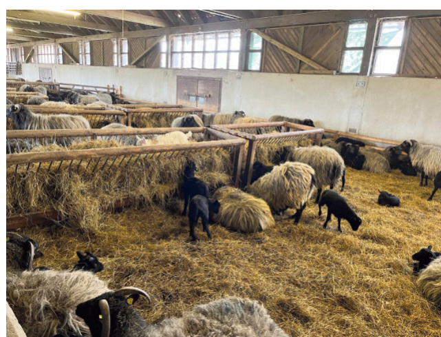
Mama-Kind-Zeit im Stall der Heidschnucken-Schäferei Senne.

Die Öffnung des Schafstalls zur Lammzeit ist möglich Dank eines vom Landschaftsverband Westfalen-Lippe (LWL) geförderten Projektes. Neben den Tagen des offe-