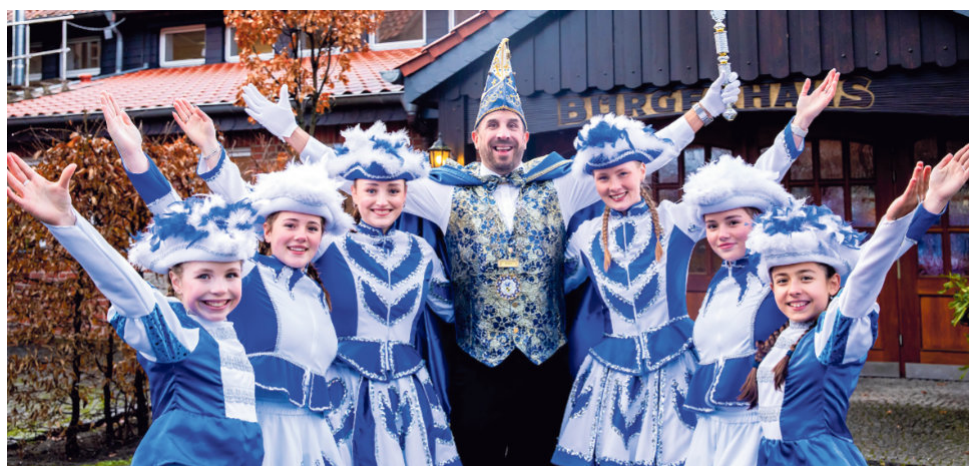
Prinzenproklamation zur Session 2026 am 15. November 2025

Schrieweshof Charleston Tagespflege Paderborn