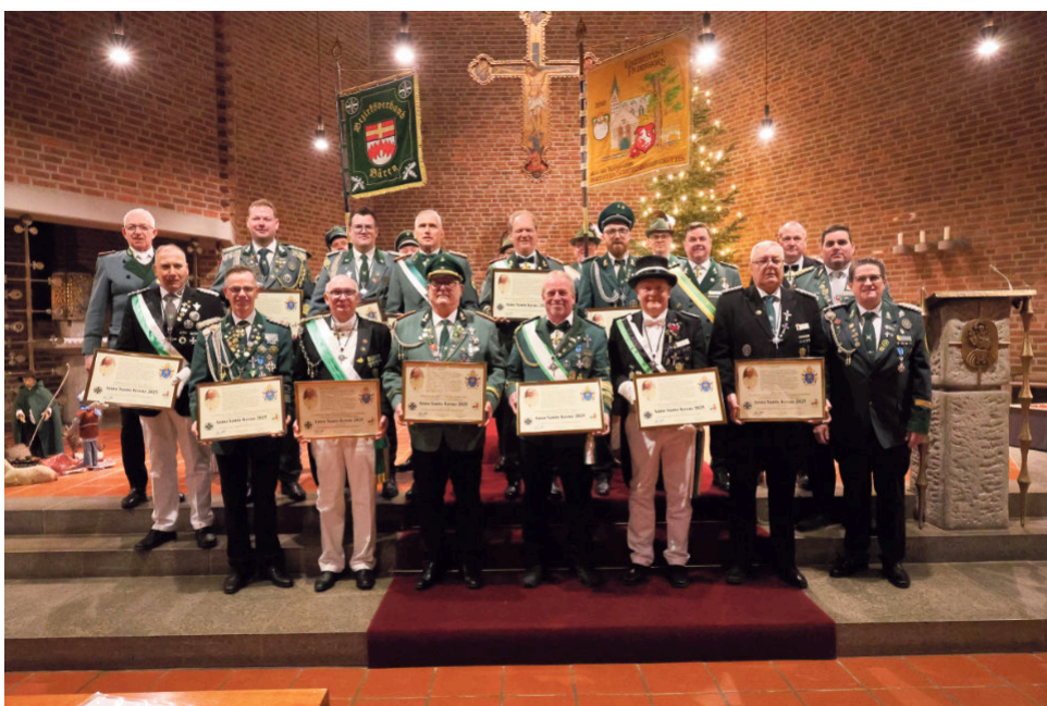
Anno-Santo-Kreuze feierlich in Paderborn verliehen.