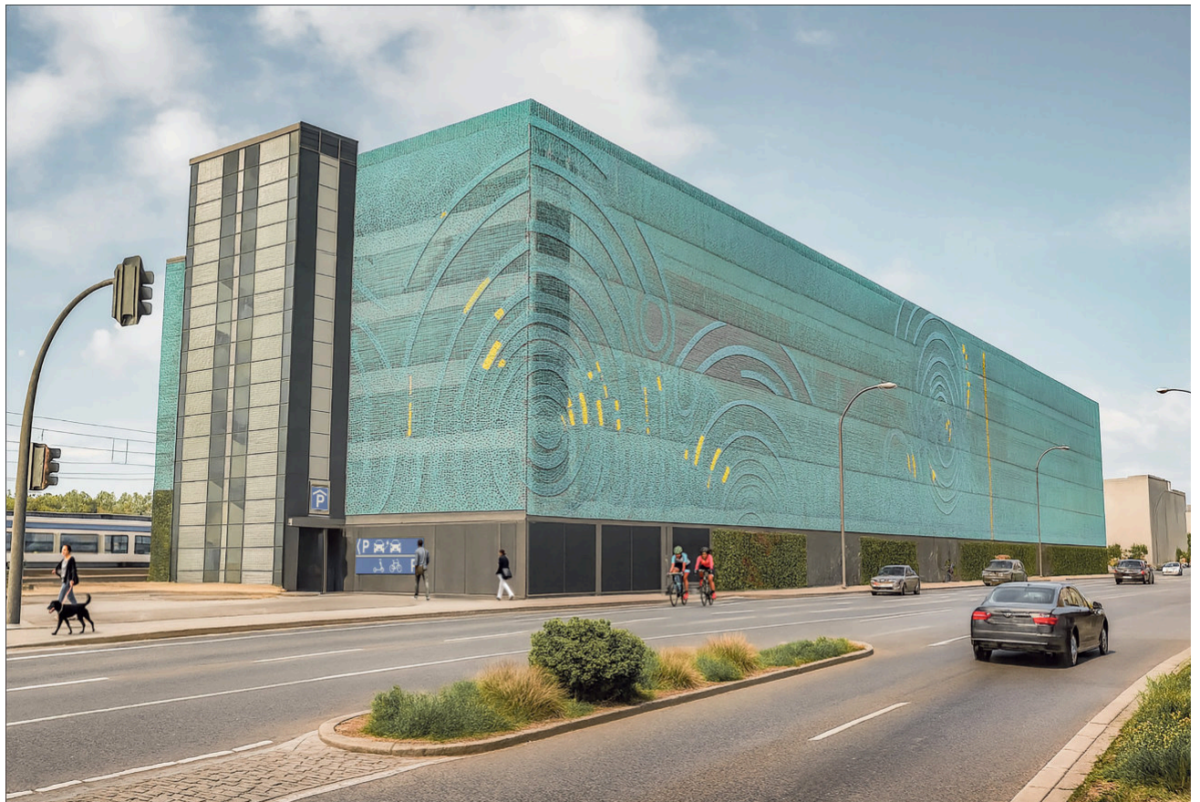
Rendering – So in etwa wird das neue Parkhaus aussehen.

Der ASP weist darauf hin, dass sich in unmittelbarer Nähe alternative Parkmöglichkeiten befinden: Die Parkplätze an der Ratenaustraße sowie an der Flori-