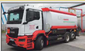
Lausen pumpt Heizöl und Diesel – jetzt leise, elektrisch und emissionsfrei!