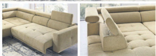
Motorischer Sitzvorschub und 1x Sitztiefeverstellung gegen Mehrpreis. Gesamtpreis inklusive oben gezeigter Funktionen 1560,-**