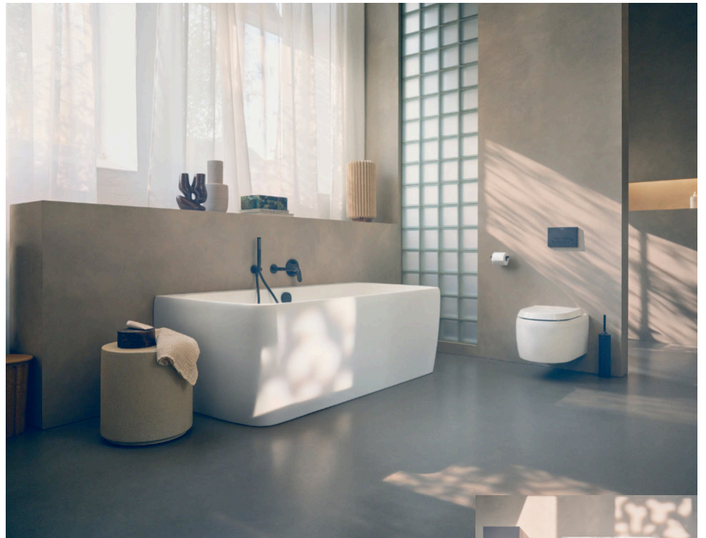
Die Serie kombiniert präzise Formen und sorgfältig ausgewählte Materialien.

Paderborn. Viele Menschen möchten es sich zuhause richtig schön machen – und das Bad spielt dabei eine immer größere Rolle. Es wird zum Ort, an dem man zur Ruhe kommt, den Tag beginnt oder bewusst ausklingen lässt. Eine klare Gestaltung, harmonische Farben und hochwertige Materialien helfen dabei, eine Atmosphäre zu schaffen, die langfristig wirkt und nicht nach kurzer Zeit aus der Mode gerät.