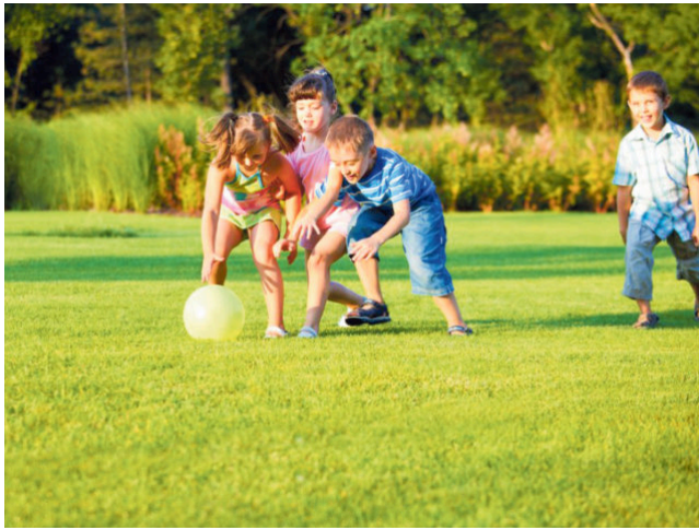
Ein kräftiger Rasen hält auch tobenden Kindern stand.

Unerlässlich ist neben Sonne, Wärme und Wasser das richtige Düngen, denn ohne Nahrung kann