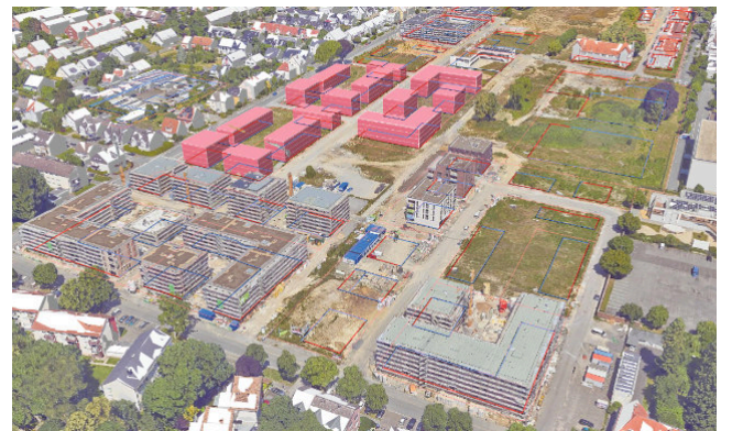
Alanbrooke-Quartier: Beispielhafte 3D-Visualisierung geplanter Gebäude im Stadtmodell des Digitalen Zwillings.

Paderborn. Beim achten Kongress der Modellprojekte Smart Cities in Berlin hatte Tanja Schürholz, Leiterin des Modellprojekts Smart City Paderborn, nun die Gelegenheit die Paderborner Entwicklungen der Bundesministerin für Wohnen, Stadtentwicklung und Bauwesen, Verena Hubertz, zu präsentieren. Diese zeigte sich begeistert, da es sich beim Digitalen Zwilling nicht nur um eine innovative Software für die Stadtplanung handelt, sondern auch ein sehr gutes Beispiel für Verwaltungsmodernisierung. So dient er verwaltungsintern als Kollaborationsplattform für die Stadtplaner*innen und weitere Beteiligte, ermöglicht Prozessoptimierungen und macht bisher händisch vorgenommene Arbeiten überflüssig. Im Rahmen des vom Bund geförderten Modellprojekts wird in Zusammenarbeit mit verschiedenen Dienstleistern der digitale Fachzwilling zur Planung von Stadtquartieren entwickelt. Dies ist für die Stadt aktuell besonders relevant, da mit dem Abzug der britischen Streitkräfte in den letzten Jahren große Flächen frei geworden sind, die nun zur Schaffung von Wohnraum und für die Entwicklung attraktiver Stadtquartiere genutzt werden. Das Ergebnis ist eine innovative Software, die den Stadtplaner*innen die Überplanung der Konversionsflächen ermöglicht und sie im Idealfall durch automatisch und ad hoc berechnete relevante Kennzahlen im Planungsprozess entlastet. So werden bei Entwurfsalternativen