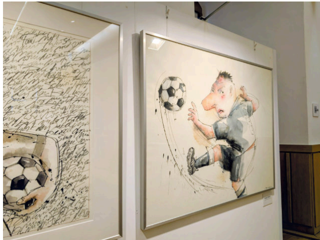
Respekt und andere Werte im Fußball – Podiumsdiskussion am Donnerstag, 28. Mai, um 19 Uhr in der Wewelsburg