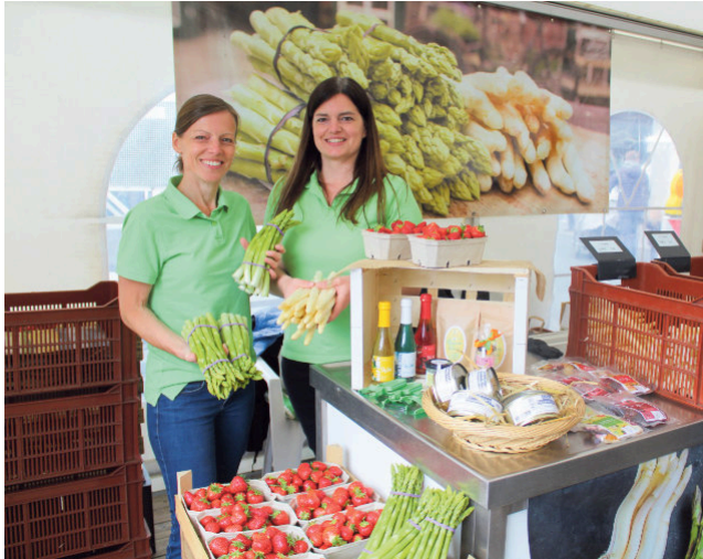
Der Spargelhof Grewing bietet auch in diesem Jahr frischen Delbrücker Spargel und selbst angebaute Erdbeeren an.

Auch in diesem Jahr erstreckt sich das Festgeschehen über den Sparkassenparkplatz sowie den Grünen Platz am Rathaus und bietet damit den idealen Rahmen für genussvolle Stunden in geselliger Atmosphäre.